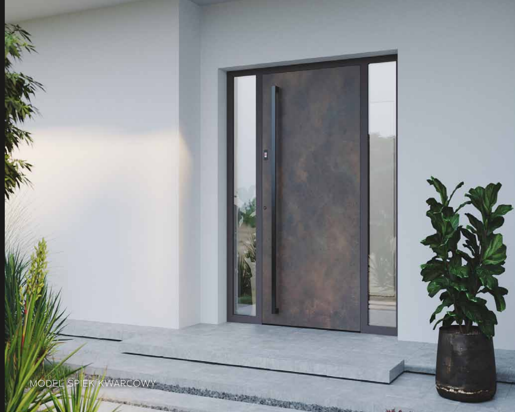
MODEL SPIEK KWARCOWY

Kolekcja Natural to wyjątkowe drzwi aluminiowe, w których modele wykonane są z zastosowaniem naturalnych surowców: spieku kwarcowego, betonu architektonicznego czy forniru kamiennego. Naturalny kamień będzie stylowym dopełnieniem drzwi w minimalistycznych i nowoczesnych przestrzeniach.