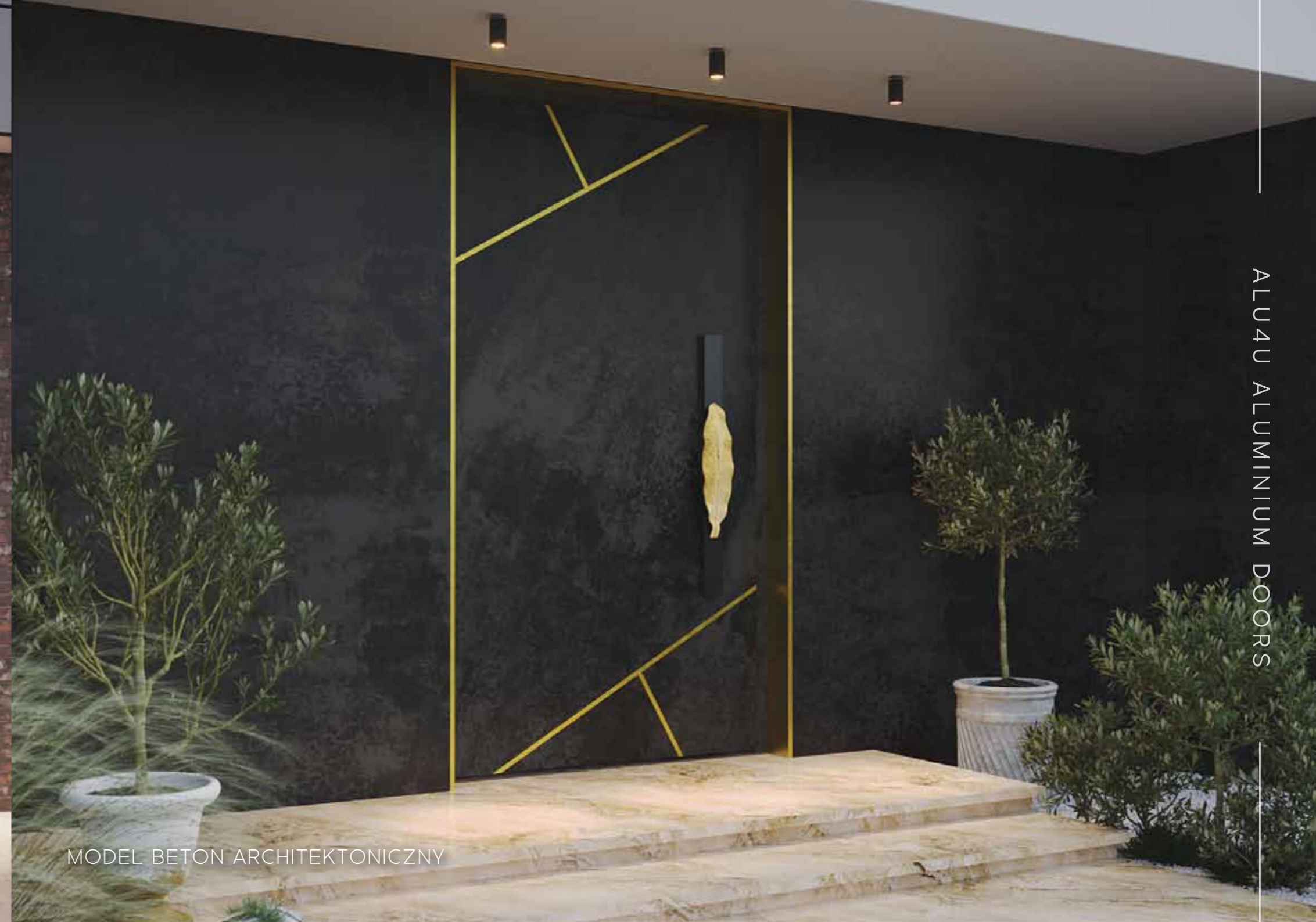
MODEL BETON ARCHITEKTONICZNY