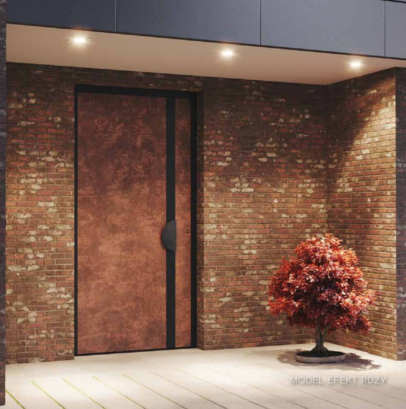
MODEL EFEKT RDZY