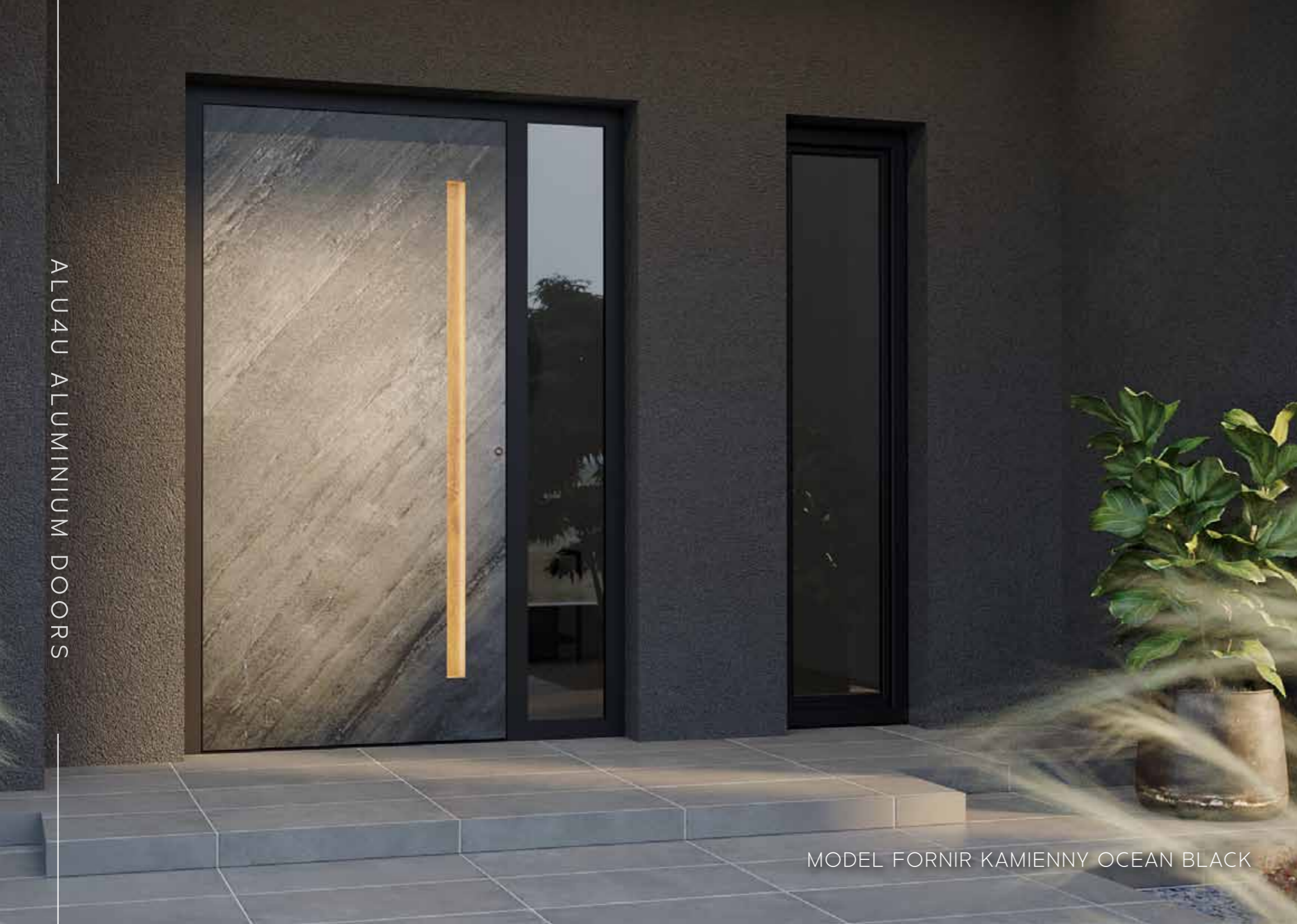
MODEL FORNIR KAMIENNY OCEAN BLACK